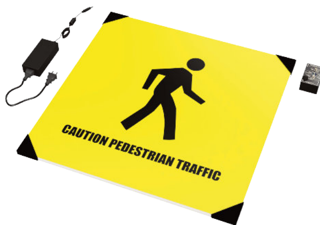
Znak jednostronny Kod: ERGO-IWKR-60-S Znak dwustronny Kod: ERGO-IWKR-60-D