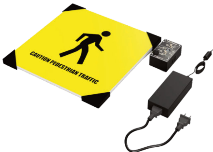
Znak jednostronny Kod: ERGO-IWKR-30-S Znak dwustronny Kod: ERGO-IWKR-30-D