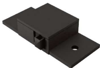
Kinetic Door Switch Kod: IWSK-SWITCH